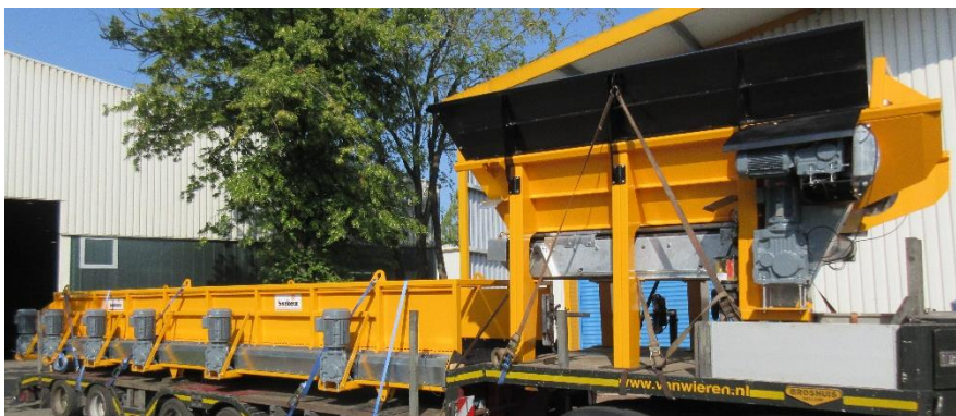
Die Sternsiebe werden mit Elektro- oder Hydraulikantrieb gefertigt. Zudem bietet die Firma Backers viele Sonderanfertigungen an.