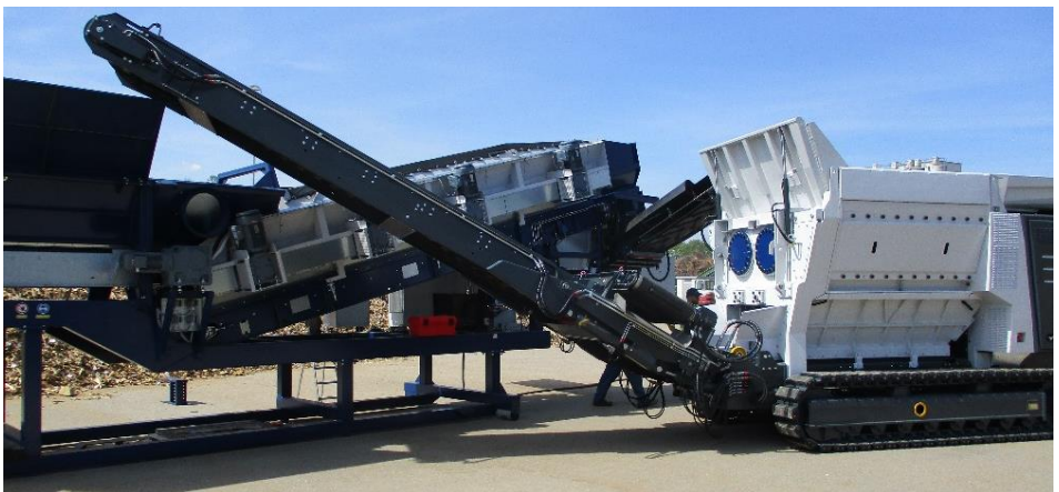
2 Wellenbrecher der Leistungsklasse 30t/h mit Sternsieb 2-sbe

Die langsam laufenden Wellenbrecher können das Altholz allerdings nicht in einem Arbeitsgang auf die gewünschte Länge reduzieren. Das Sternsieb sibt das feine Material aus und fördert die Überlängen in den Brecher zurück.