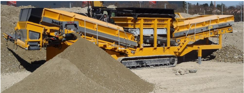
Sternsieb 3-tbl+ (mit Stangenrost und längerem Grobsieb)

Der Grizzlyscreen auf dem Material-Aufgabebunker ist mit stark gelagerten, rotierenden Walzen bestückt. Er wird mittels Bagger oder Radlader befüllt und trennt Material größer 200mm. Bindiger Boden wird dabei aufgelockert und im Anschluss wird auf dem Sternsieb 2-ta bei 22/25mm Trenngröße gesiebt. Dann werden die gereinigten Steine in den Prallbrecher gefördert und gebrochen. So wird mit sehr hoher Leistung in einem Arbeitsgang sehr sauberes Material erzeugt. Die gut gereinigten Steine aus dem Lehm Boden können so als Frostschticht genutzt werden. Der gesiebte Boden kann als Füllmaterial (vor Ort) eingesetzt werden.