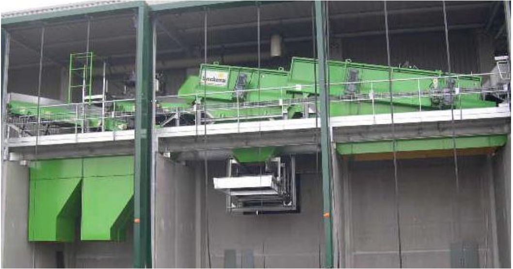
2 Sternsiebdecks in Reihe mit E-Antrieb.