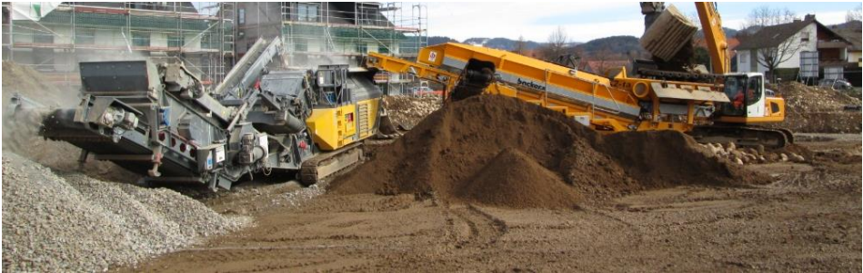
Sternsieb 2-ta mit Prallbrecher

Abraum, Lehm Böden und Rotlage werden mit dem Sternsieb gut gereinigt und danach mit einem Prallbrecher gebrochen. So werden saubere und gut verwertbare Stoffströme hergestellt. Erst sieben, dann brechen.