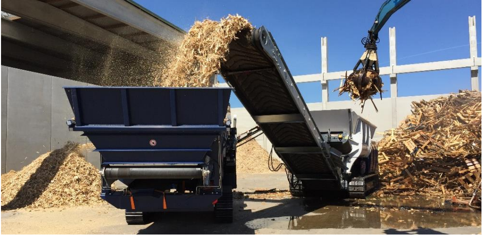
2 Wellenbrecher der Leistungsklasse 50t/h mit Sternsieb 2-tb17

Die Sternsiebe der Firma Backers werden weiterhin auch zum Sieben von organischen Materialien eingesetzt. Hier ist die Vorgehensweise zuerst Brechen und dann Sieben. Schwere und sehr starke, langsam laufende Walzenbrecher zerkleinern das Altholz. Dieser Vorgang erzeugt relativ geringe Staubemissionen ebenso fallen Kraftstoffverbrauch und Verschleiß niedrig aus. Türschlösser, Scharniere und auch Fahrräder sind für die schweren Brecher kein Problem. Metall wird durch einen Überbandmagneten entnommen.