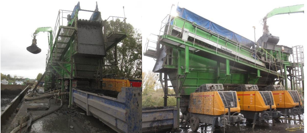
Sternsieb mit 1,7m Siebbreite als Schutzsieb für Kanalaushub- Förderpumpe. Es wird bei 60mm Durchmesser und maximal 180mm Länge gesiebt. Der Feinanteil wird mit 3 Betonpumpen 500 - 800m weit gefördert.