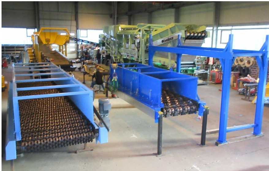
Montagehalle für die Fertigung von stationären und mobilen Sternsiebe im Standort Twist.

Die Firma Backers Maschinenbau GmbH fertigt Sternsieb- und Mischtechnik für stationäre und mobile Einsätze. Weiterhin sind Vorabscheider wie Stangenrost und Grizzlyscreen sowie Trenntechnik mit Magnetabscheider und Windsichter im Portfolio.